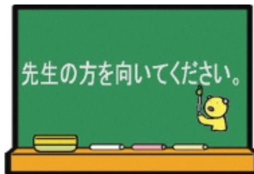
一斉呼び出し画面

教師のデスクトップから生徒の注意を促すため下記の画面を表示し、生徒のキーボード、マウスをロックします。